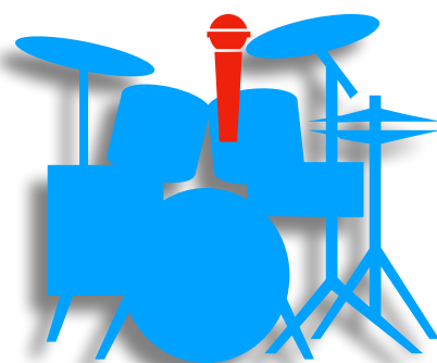
Drums / Chant