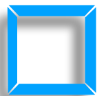
Ampli guitare 2