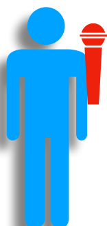
Guitare 1 / Chant